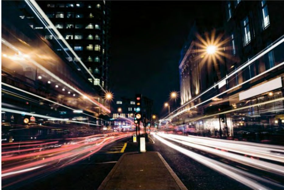
Figura 3: Perfecto para operaciones de servicios básicos y servicios públicos: zenon Energy

de control. Muchas operaciones de utilidad o servicios públicos controlan o monitorizan no solo la electricidad con sus sistemas de control, sino también controlan y monitorizan otros servicios como el agua, las telecomunicaciones, la televisión por cable o el tráfico. zenon EE puede conectarse a muchos tipos diferentes de dispositivos sin ningún tipo de problema.